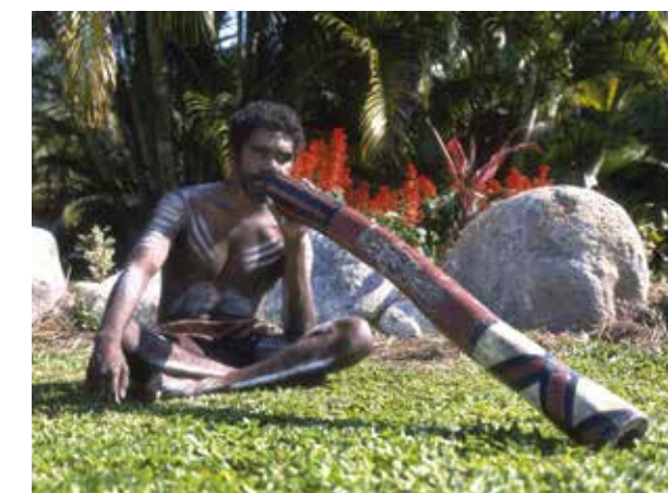
Foto: Dallas en John Heaton, www.fotosearch.nl (opgenomen in Stepping Stones )

een leestekst over de traditionele levensstijl van sommige Aboriginals. De opdrachten in het tekst- en activiteitenboek maken verder geen gebruik van het beeld, terwijl het inhoudelijk, beeldtechnisch en didactisch veel te bieden heeft.