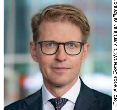
Demissionair minister Sander Dekker

Mooie plannen. Echter, zonder onze studenten komt er niets van terecht. Want zij zijn het die het verschil gaan maken in de eerstelijns rechtsbijstand. Onze HBO-juristen (SJD en HBR) worden opgeleid tot klantgerichte dienstverleners die bij uitstek in staat zijn om wet- en regelgeving begrijpelijk te maken voor de burger. Relevante vaardigheden en gedegen kennis van het recht vormen een Siamese tweeling. Onze studenten zijn kritisch en hebben lef. Zij durven werkelijk maatwerk te leveren aan de burger en aarzelen niet om daarin de grenzen op te zoeken. Zij worden de medewerkers die